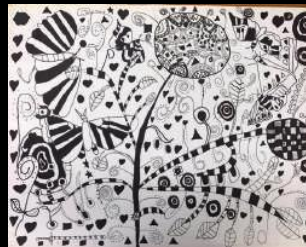
畫家：劉易玟 作品：花。心 沉穩的黑白，孕出繽紛生機。 心的呵護、花朵的話語、 昆蟲的活力、蝴蝶的蛻變。