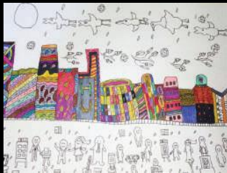
畫家：梁嘉茵 作品：舞屋 靈活城市，大樓都在舞動

袁詠儀首次和顯能創作(於2009年成立的慈善機構)合作，挑選了其中兩位學員的畫作加上自己和兒子的親筆簽名，製作成親子系列環保袋。